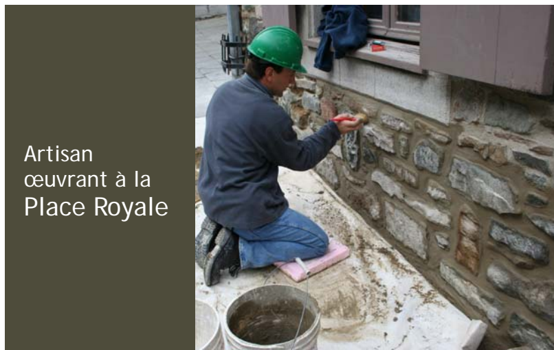
Artisan œuvrant à la Place Royale