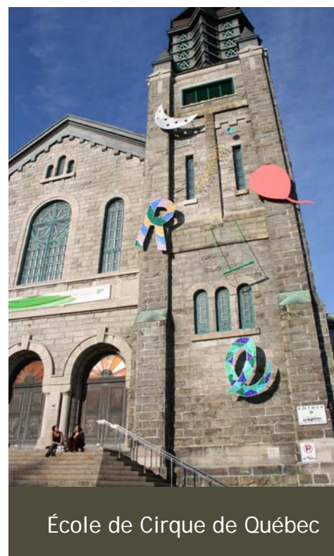
École de Cirque de Québec