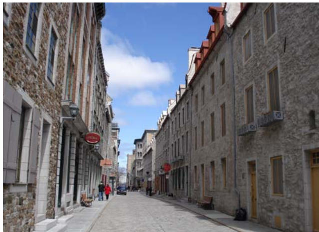
Vue de la basse-ville

Il a pratiqué à titre d'expert-conseil indépendant en matière de patrimoine, comme agent et planificateur de la conservation à la ville de Toronto. Il est aussi ancien membre du Conseil de l'Association canadienne d'experts-conseils en patrimoine (ACECP) et est un directeur de l'Association pour la préservation et ses techniques internationales (APT).